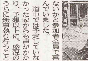
道中では予定していな かった家からも声がかか り、予想以上に、盛況の うちに無事執り行うこと になりました。

【飯塚市】有井地区で 10月31日、獅子舞が行わ れました。写真 今年は宝くじ助成事業 の補助金が交付され、獅 子の衣やのぼりを新調し たり、猿田彦の面の修理 などをして獅子舞をする ことができました。 当日は、鹿毛馬の厳島 神社へ参内し、奉納舞を 行いました。 台風の影響でいつ雨が 降り始めるかわからない 状況でしたが、獅子舞が 行われていた間は雨が降 りませんでした。