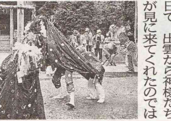
道中では予定していな かった家からも声がかか り、予想以上に、盛況の うちに無事執り行うこと になりました。

【飯塚市】有井地区で 10月31日、獅子舞が行わ れました。写真 今年は宝くじ助成事業 の補助金が交付され、獅 子の衣やのぼりを新調し たり、猿田彦の面の修理 などをして獅子舞をする ことができました。 当日は、鹿毛馬の厳島 神社へ参内し、奉納舞を 行いました。 台風の影響でいつ雨が 降り始めるかわからない 状況でしたが、獅子舞が 行われていた間は雨が降 りませんでした。