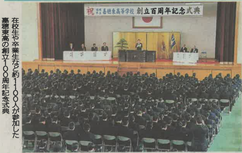
在校生や卒業生など約1000人が参加した嘉穂東高の創立100周年記念式典

福智町 22-5146 同町 22-5146 同町 28-6041 同町 26-3292 川添香 0948- 崎町 0948- 町 0948- ター 0948- 西日本新聞広告社筑豊 0948- 西広筑豊営業所 0948- 西日本新聞筑豊折込セン 0948-